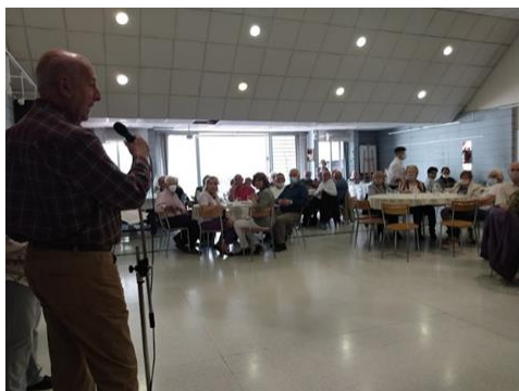
Salón principal JUBINAR

EL VIERNES 17 DE DICIEMBRE FESTEJAREMOS LA FINALIZACION DE ESTE AÑO 2021 AUGURANDO UN 2022 CON SALUD Y PAZ.