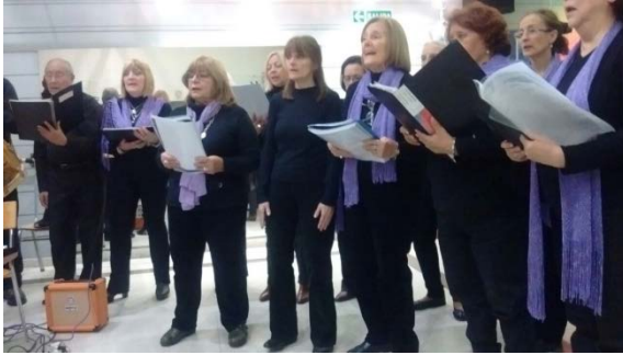
Coro "PUAM" (U.N.C.)