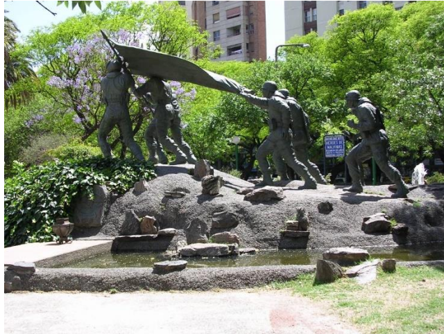
Monumento conmemorativo - Plaza de la Intendencia – Córdoba La obra “ Héroes de Malvinas ”, inaugurada en 1983, pertenece al artista cordobés Marcelo Hepp