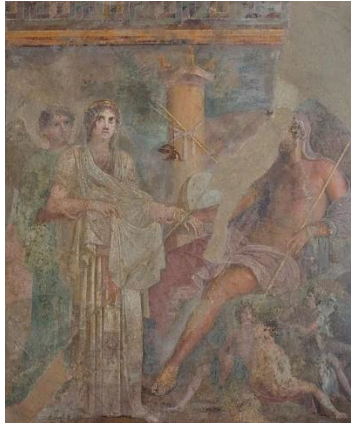
Boda de Juno y Júpiter