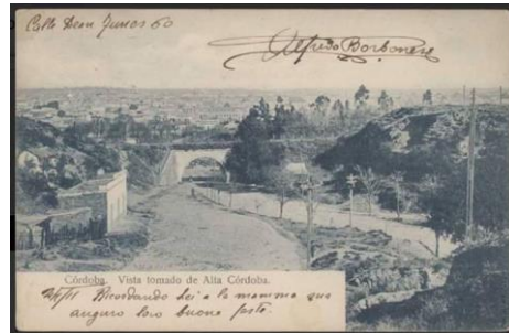
Vista de Córdoba tomada desde Alta Córdoba - 1911

El 6 de julio de 1573 Jerónimo Luis de Cabrera fundó la ciudad de Córdoba de La Nueva Andalucía, a orillas del río Suquia, en un sitio llamado Quizquizacate por los lugareños («Encuentro de los ríos» en idioma sanavirón). El nombre dado por Cabrera a la ciudad es un homenaje a su ciudad natal, la ciudad española de Córdoba en la comunidad de Andalucía.