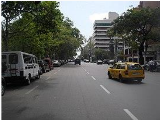
Vista de la avenida hacia el este.

La batalla de Tucumán fue un enfrentamiento armado librado el 24 y 25 de septiembre de 1812 en las inmediaciones de la ciudad de San Miguel de Tucumán, durante la segunda expedición auxiliadora al Alto Perú en el curso de la Guerra de la Independencia Argentina. El Ejército del Norte, al mando del general Manuel Belgrano , a quien secundara el coronel Eustoquio Díaz Vélez en su carácter de mayor general, derrotó a las tropas realistas del brigadier Juan Pío Tristán, que lo doblaban en número, deteniendo el avance realista sobre el noroeste argentino.