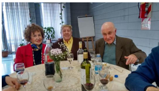
Alegre mesa en almuerzo Junio...

Recordamos a nuestros lectores, que en la PAGINA WEB : www.jubinar.org.ar hay un titulo "GALERIA" donde se incorporan mensualmente todas las fotos disponibles en esta Redacción. INVITAMOS A COMPARTIRLAS.