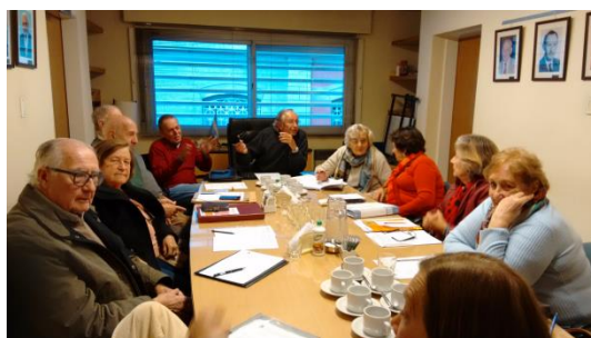
Comisión Directiva JUBINAR en acción...